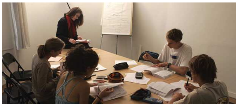
La Cnil épingle les pratiques douteuses du leader français des cours de soutien